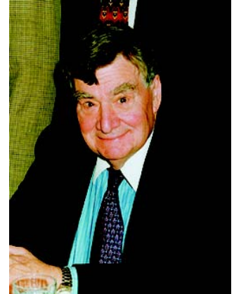
Pierre Salinger Porte-parole de J.F. Kennedy Fondateur du Comité d’Éthique des éditions USD-System

Avis de décès : Notre très regretté ami, Pierre Salinger, nous a quitté samedi 16 octobre 2004... Il avait accepté le 16 septembre 1998 à Montréal de fonder et de présider le Comité d’Éthique de notre Consortium. Ce sera désormais sous l’égide de sa défunte personnalité que ses successeurs seront appelés à reprendre le flambeau de la tâche qu’il avait considérée comme étant une véritable mission.